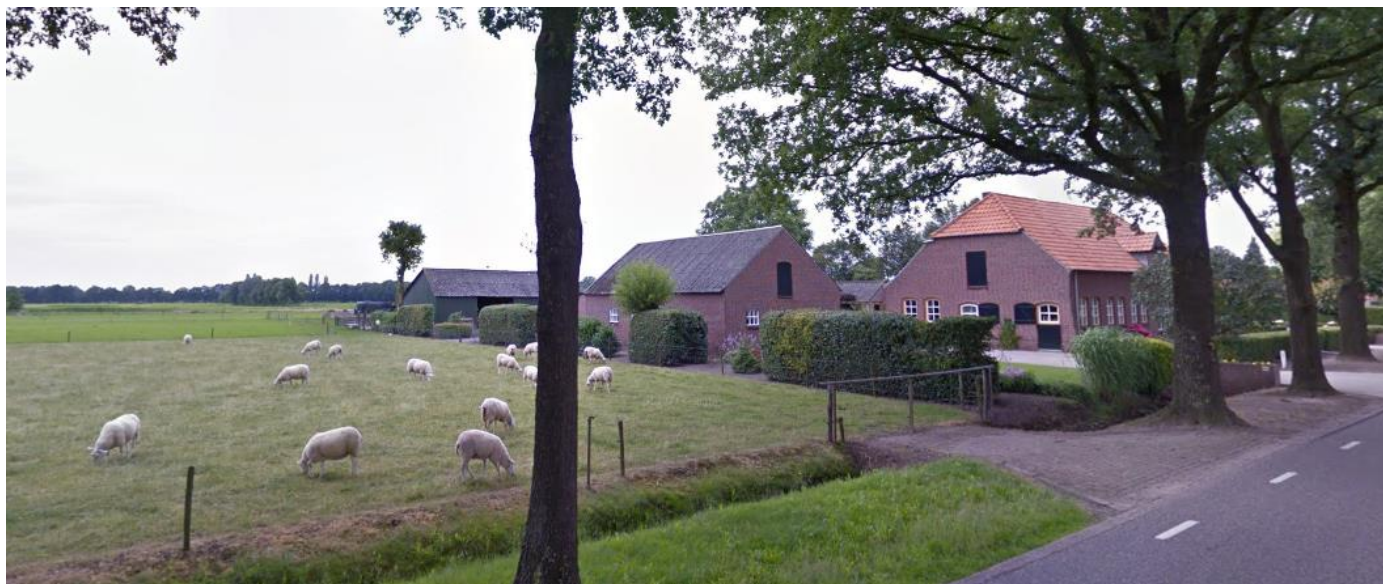
Bovenstaande foto is het beeld vanaf de Boerdonksedijk.