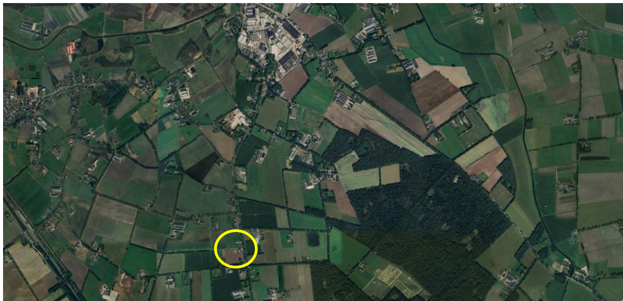
Locatie aangegeven op luchtfoto