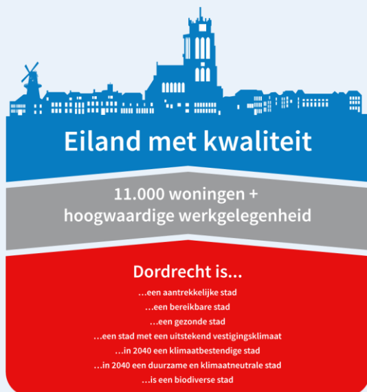
Figuur 1 - Schematische weergave hefboomwerking van de hoofdpoging

De hoofdpoging gaat uit van het bouwen van 11.000 woningen. Dit vraagt om ruimte.