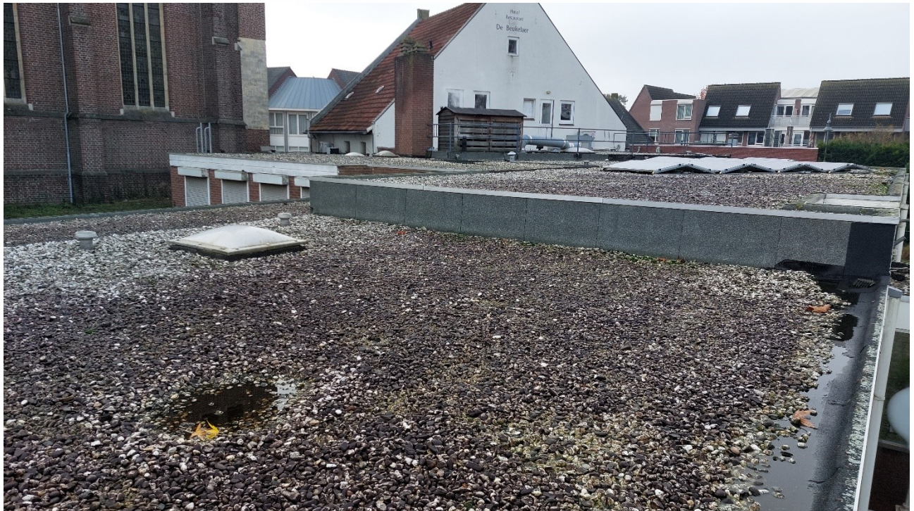
Figuur 4.4.1. De te slopen bebouwing bevat een kiezeldak, dat door de scholekster als broedlocatie kan worden gebruikt.

De te slopen bebouwing bevat geen open stootvoegen, ventilatiesleuven, of andere openingen in de gevels waardoor vleermuizen de spouw kunnen bereiken, en het daktrim sluit nauw aan op de gevels (zie figuur 4.4.2 en 4.4.3). Het voorkomen van gebouw-bewonende vleermuisverblijven is in het plangebied daardoor uitgesloten.