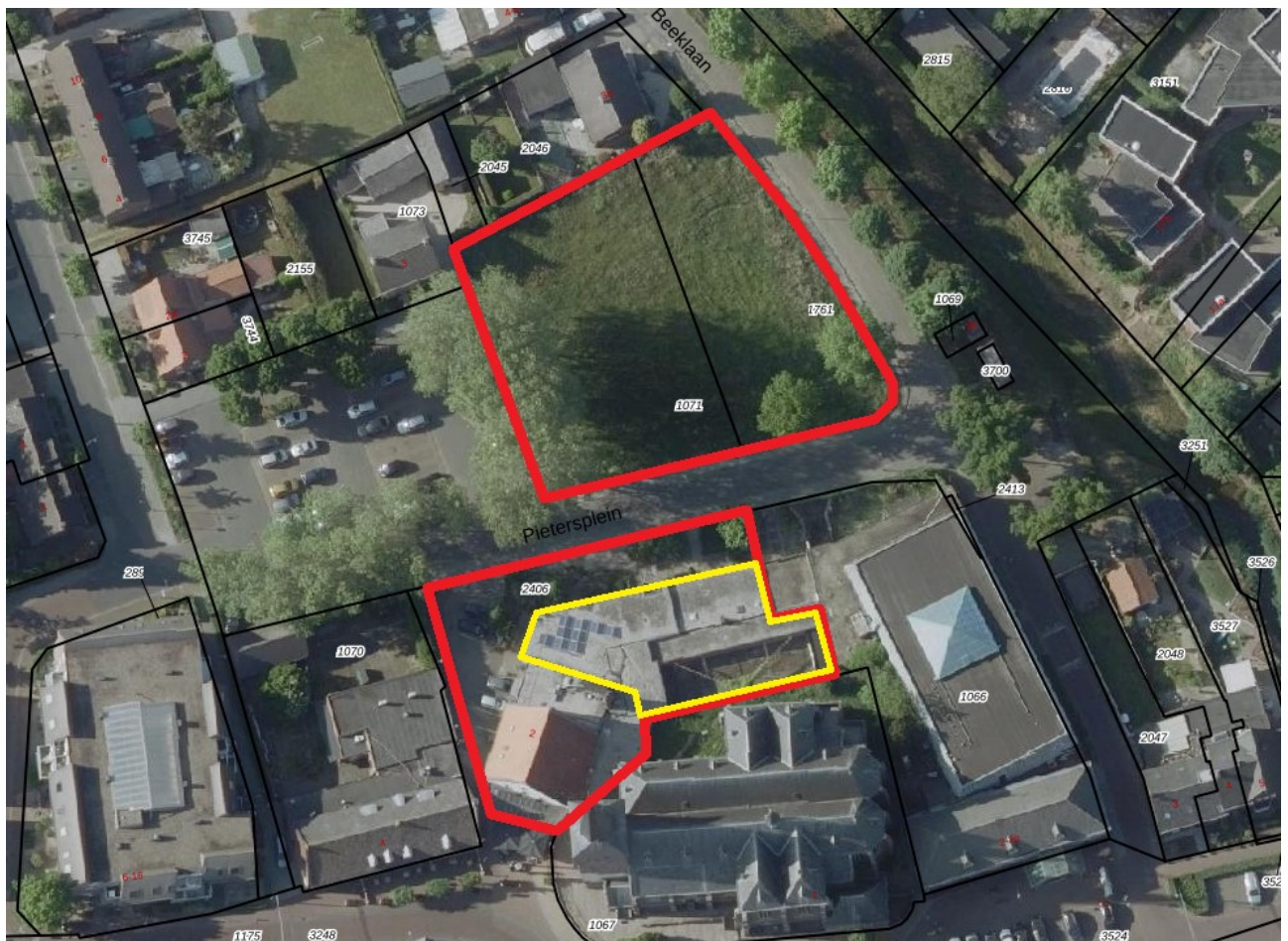
Figuur 4.1. Het plangebied (rood omlijnd) met de te slopen bebouwing (geel omlijnd).

Het plangebied (zie figuur 4.1. en de foto's op pagina 2) bevindt zich in het centrum van Roggel, grenzend aan de St. Petruskerk. De omgeving is stads ingericht met woningen, winkels, restaurants etc. Het plangebied aan beeklaan ong. bestaat uit een grasveld met daarin algemeen voorkomende plantensoorten als smalle weegbree, zachte ooievaarsbek, scherpe boterbloem, duizendblad, knoopkruid, veldzuring, rode klaver, Jacobskruiskruid, vogelwikke, boerenwormkruid, grote brandnetel en melganzenvoet. Het plangebied aan Kerkstraat 2 bestaat uit de zalen van een restaurant, met daaromheen wat verharding en tuinvegetatie. In de tuinvegetatie groeien algemene plantensoorten als Noorse esdoorn, amberboom, taxus, fijnspar, kronkelhazelaar, pampagras, hortensia, hemelse bamboe, Carex spec. , en druifheide.