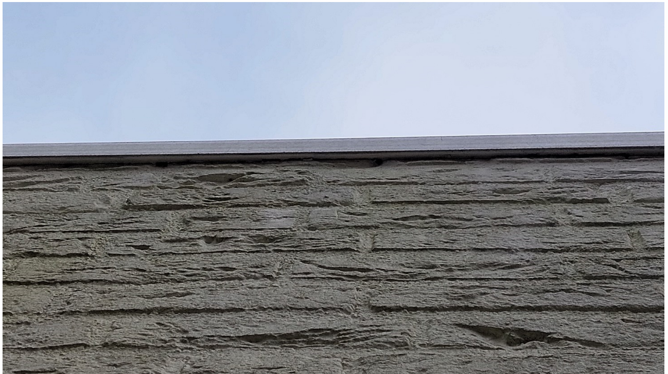
Figuur 4.4.3. Het dakrim sluit nauw aan op de gevels.

Tijdens het veldbezoek zijn de huismus, koolmees en kauw waargenomen. De bomen in en rond het plangebied bevatten geen (roof)vogelnesten, eekhoornnesten of holtes. Door de afwezigheid van holtes zijn verblijven van boom-bewonende vleermuissoorten en uilennesten in en rond het plangebied ook uitgesloten. Het is wel mogelijk dat algemene vogelsoorten als de merel gedurende het broedseizoen in de opgaande vegetaties in het plangebied broeden. De bomen betreffen op zichzelf staande bomen en vormen daardoor geen hoger opgaande lijnvormige vegetatiestructuren die kunnen fungeren als vaste vliegrouwe of als foerageergebied voor vleermuizen.