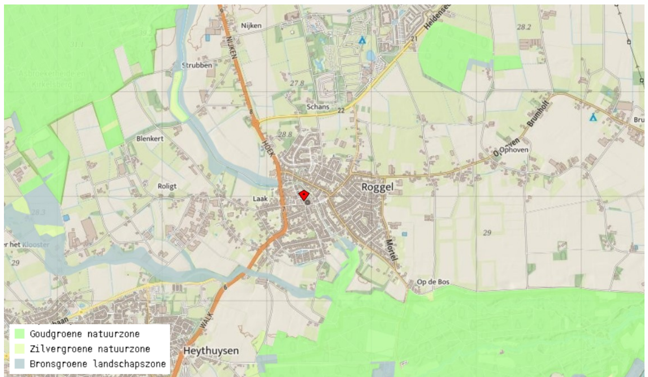
Figuur 4.3. Globale ligging van het plangebied (rode marker) ten opzichte van het NNN (gekleurde delen).

De bronsgroene landschapszone omvat de landschappelijk waardevolle beekdalen en bufferzones rond bestaande natuurgebieden met de daarin aanwezige (extensievere) landbouwgebieden, monumenten, kleinere landschapselementen, waterlopen e.d. Een kwart van de bronsgroene landschapszone wordt gevormd door het winterbed van de Maas. In Zuid-Limburg omvatten deze zones ook de steilere hellingen, droogdalen en de belangrijkste landschappelijke verbindingen naar het Maasdal. Het beleid binnen de bronsgroene landschapszone is er op gericht om de landschappelijke kernkwaliteiten te behouden, te beheren, te ontwikkelen en te beleven. Deze zone bestaat hoofdzakelijk uit landbouwgronden. Binnen deze zone komen op bestemmingsplanniveau andere bestemmingen en functies voor zoals infrastructuur, woningen en toeristische voorzieningen e.d.