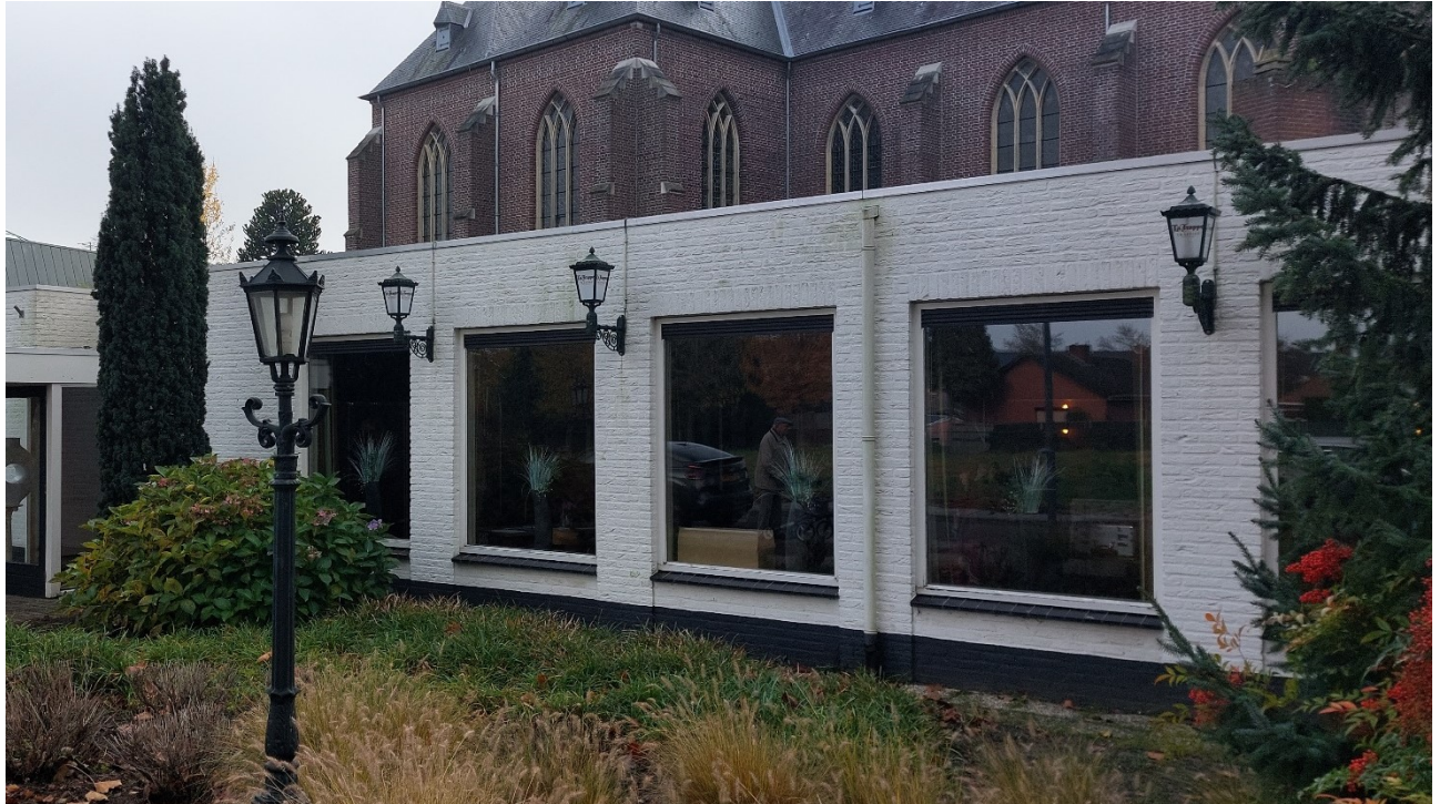
Figuur 4.4.2. Openingen, spleten, open stootvoegen etc. zijn in de gevels afwezig.