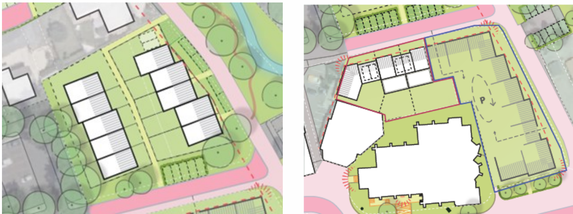
Figuur 3.1. Schetsen van de voorgestane situatie van Beeklaan ong. (l) en Kerkstraat 2 (r; roze omljnde deel).

Aan de Beeklaan ong. wordt de grasvegetatie verwijderd; de bomen blijven behouden. Aan de Kerkstraat 2 worden de zalen van restaurant de Beukelaer gesloopt en de vegetatie verwijderd. Het hoofdgebouw van het restaurant blijft behouden. Vervolgens worden op beide locaties nieuwe woningen gerealiseerd. Zie figuur 3.1 voor schetsen van de voorgestane situaties.