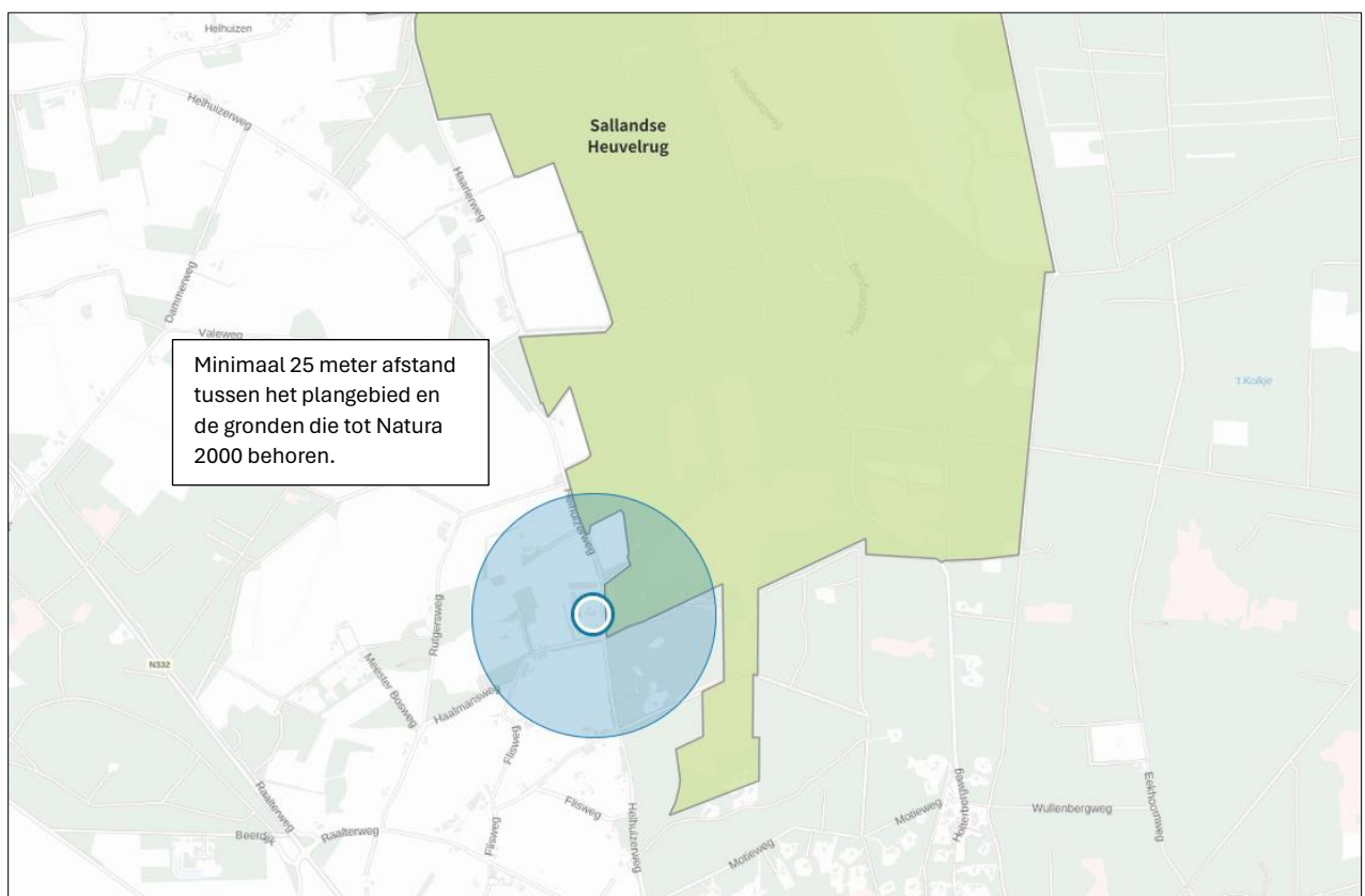
Ligging van Natura 2000-gebied in de omgeving van het plangebied. De ligging van het plangebied wordt met de blauwe cirkel aangeduid. Gronden die tot Natura 2000 behoren worden met de okergele kleur aangeduid.

Het plangebied ligt op minimaal 25 meter afstand van Natura 2000-gebied. Het meest nabij gelegen Natura 2000-gebied is Sallandse Heuvelrug. Op onderstaande afbeelding wordt de ligging van het Natura 2000-gebied in de omgeving van het plangebied weergegeven.