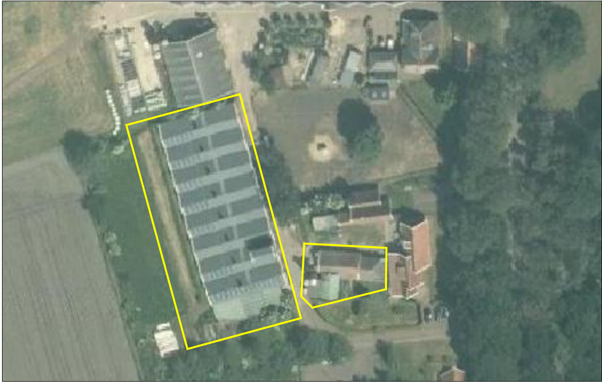
Luchtfoto met de begrenzing van het plangebied, aangegeven met de gele lijn (bron: ruimtelijkeplannen.nl).

Het erf bestaat uit een agrarisch erf met een kalverstal en twee schuren die dienen als opslagplaats. De kalverstallen hebben een bakstenen buitengevel met luchtspouw en een dak van golfplaten. In de buitengevel zijn geen open stootvoegen aanwezig en de betimmering van het dakoverstek sluit nauw aan op de buitengevel. De schoppe heeft een niet geïsoleerd pannendak en een houten gevelbetimmering. De schuur ten zuiden van de schoppe bestaat aan de buitenkant volledig uit damwandplaat. Aan de westzijde van de kalverstal staat een laurierkershaag en aan de zuidzijde is begroeiing van vlier en braam.