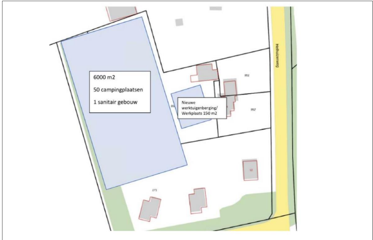
Plattegrond van de wenselijke eindbeeld (Bron: BJZ).

Er zijn plannen om de kalverstal en twee schuren op het adres Helhuizerweg 14 in Holten te slopen. Op het erf wordt een camping met 50 campingplaatsen, een nieuw sanitairgebouw en een werkplaats gerealiseerd.