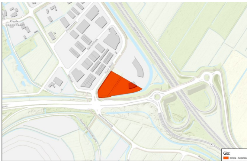
Werkingsgebied 'verbod oprichten zelfstandige horeca'

Op de afbeelding hieronder staat het werkingsgebied van de (voor)rang(s)regel weergegeven.