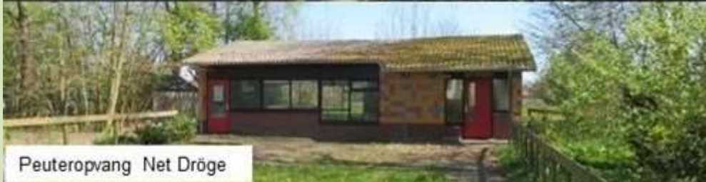
Peuteropvang Net Dröge