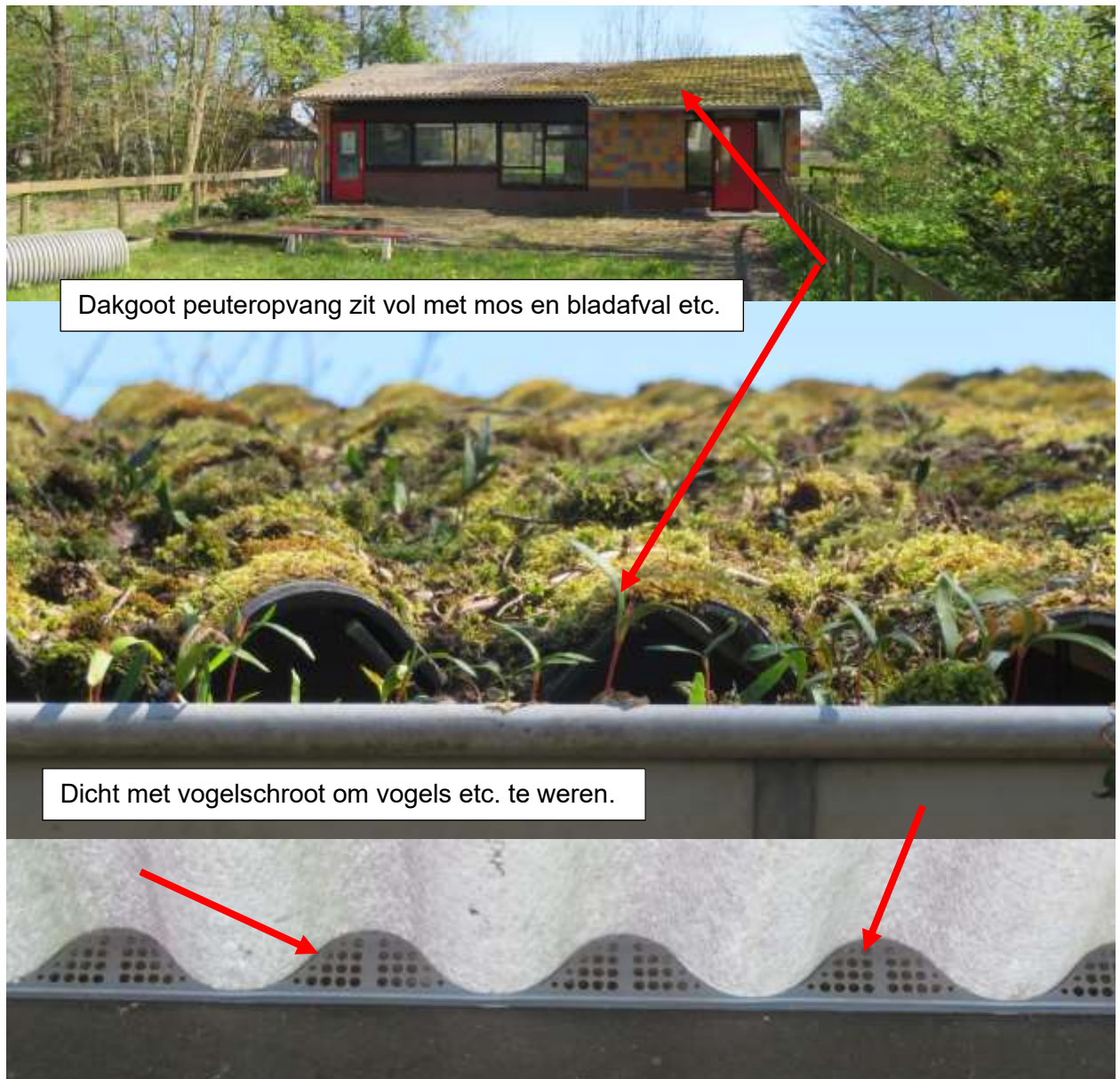
Dakgoot peuteropvang zit vol met mos en bladafval etc.

Aanwezigheid van gebouwbewonende vleermuizen (zoals bijvoorbeeld gewone dwergvleermuis en laatvlieger) is eveneens uitgesloten. Er zijn geen sporen gevonden die erop kunnen duiden dat vleermuizen de bebouwing als onderkomen gebruiken. Het schoolgebouw (met bitumen, dakplaten in dakpanmotief en vogelschroot) en het gebouw voor de peuteropvang met asbestplaten met vogelschroot en dichtgegroeide dakgoten zijn hiervoor ook niet geschikt vanwege het ontbreken van geschikte wegkruipmogelijkheden. Ook bij de gevelbetimmering van het schoolgebouw met onder andere Trespa plaat zijn geen geschikte ruimtes waargenomen. Er zullen geen negatieve effecten optreden voor vleermuizen tijdens de voorgenomen werkzaamheden.