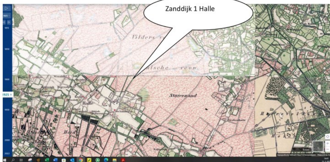
Landschappelijke situatie 1925

Het plangebied ligt op de lagere zandgronden ten noordoosten van het dorp Halle en ten noorden van de zogenaamde 'Halsche Rug', een langerekte hogere gordel dekzandgronden.