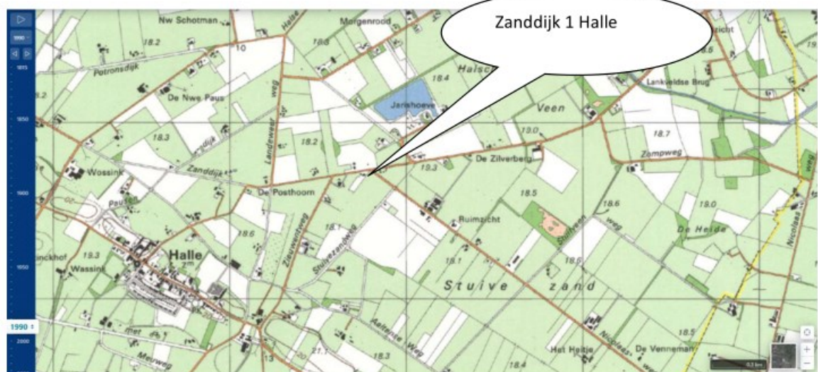
Landschappelijke situatie 1990

Het agrarische toeleveringsbedrijf Essink Veevoerders is ontstaan in de 2 e helft van de jaren tachtig van de vorige eeuw bij de aansluiting van de Nicolaasweg op de Zanddijk.