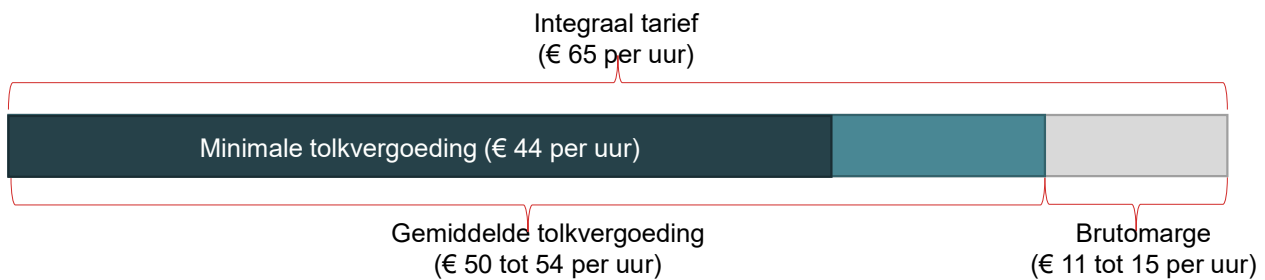
Figuur 2 Op basis van de huidige contracten ligt de brutomarge van intermediairs tussen de 17 en 23 procent

Figuur 2 laat de huidige opbouw van het integrale tarief zien. Van het integrale tarief van € 65 per uur in de huidige contracten gaat minimaal 67 procent – de wettelijke afgeronde € 44 per uur – naar de tolken en in totaal gemiddeld 77 tot 83 procent (€ 50 tot € 54 per uur) naar de tolken. 3 Dit betekent dat een tolk minimaal € 44 per uur vergoed krijgt en alle tolken gezamenlijk gemiddeld € 50 tot € 54 per uur. Hoe deze vergoeding verdeeld is over de verschillende tolken en tolkdiensten is echter niet bekend. Het gemiddelde van € 50 tot € 54 per uur kan bijvoorbeeld sterk opwaarts worden beïnvloed door het moeten leveren van enkele schaarse tolken waarvoor in de markt een hoger uurtarief geldt. Ter illustratie, als de intermediair in 15 procent van de gevallen een vergoeding van € 100 per uur hanteert, moet in de overige 85 procent een vergoeding van € 44 per uur gelden om uit te komen op de door de overheid gerapporteerde gemiddelde tolkvergoeding van tussen de € 50 en € 54 per uur.