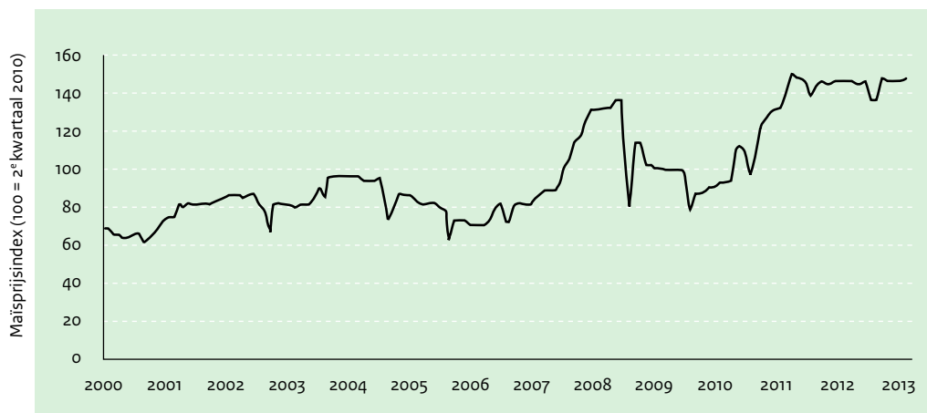
Figuur 2: Geïndexeerde maïsprijzen 2000-2013 gebaseerd op prijzen van het LEI 50, 51

Veel gebruikt gewas voor energieopwekking in Nederland is energiemaïs (snijmaïs). De in Nederland geproduceerde snijmaïs (230.000 hectare) gaat voor het grootste deel naar de ruwvoederindustrie, slechts enkele procenten wordt gebruikt voor energieopwekking via (co)vergisting. Uit enquêtes onder exploitanten van vergistinginstallaties 49 is naar voren gekomen, dat de prijs van energiemaïs over 2011 en 2012 verder met circa 25 procent is toegenomen. De inzet van energiemaïs en industrieel afval in de vergisters is in 2011 en 2012 sterk afgenomen. De grote vergisters met maïs als (co)substraat werken met lange termijn contracten en merken weinig van de volatiele dagmarkt. De dagprijs van de energiemaïs wordt vooral beïnvloed door oogstverwachtingen en de vraag. Uit de bedoelde evaluatie komt verder naar voren dat de prijs van de voor vergisting gebruikte co-substraten, naast maïs zijn dat vooral reststromen, stijgt door toenemende vraag uit het binnenland en de buurlanden, waar een gunstiger subsidieklimate is. Deze stijging heeft zich de laatste jaren voortgezet. Substraatkosten maken voor circa 1/3 deel uit van de exploitatiekosten.