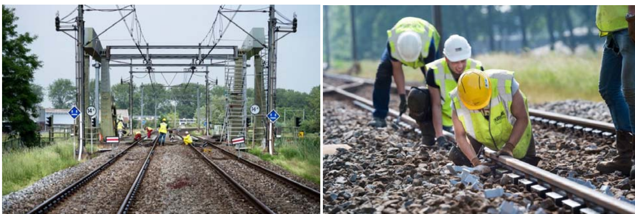
Afbeeldingen: aanleg raildempers in Purmerend

Al voor het kalenderjaar 2013 is geconstateerd dat tussen Zaandam en Enkhuizen, ter hoogte van Purmerend, een gpp-overschrijding was ontstaan. Middels een tijdelijke ontheffing van de naleving is door het Ministerie van Infrastructuur en Waterstaat aan ProRail tijd gegeven om de aanleg van bronmaatregelen voor te kunnen bereiden en uit te voeren. In het voorjaar van 2017 zijn op het betreffende deel van het baanvak over een lengte van ruim 700m raildempers aangebracht. Door de toepassing van deze bronmaatregelen is de overschrijding van de gpp's beëindigd.