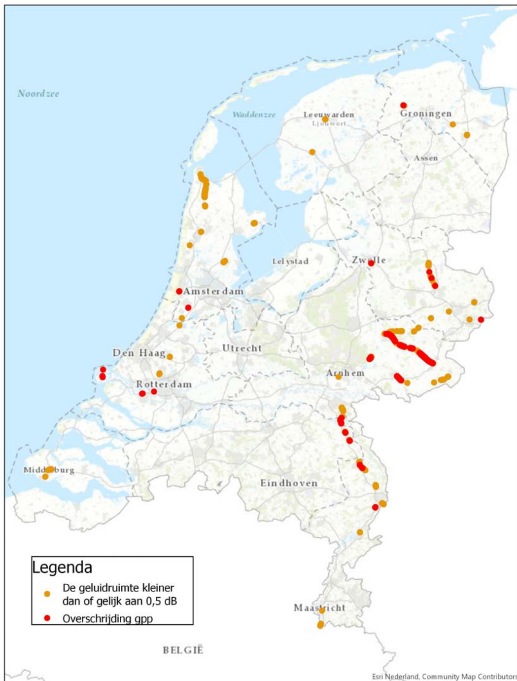
Figuur 1: Landelijk beeld van gpp-overschrijdingen en baanvakken met een krappe geluidruimte

In de volgende paragrafen worden de twee categorieën gpp-overschrijdingen nader uitgewerkt.