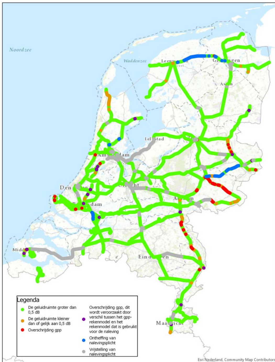
Figuur 2: Landelijk beeld van de gpp-naleving in 2017