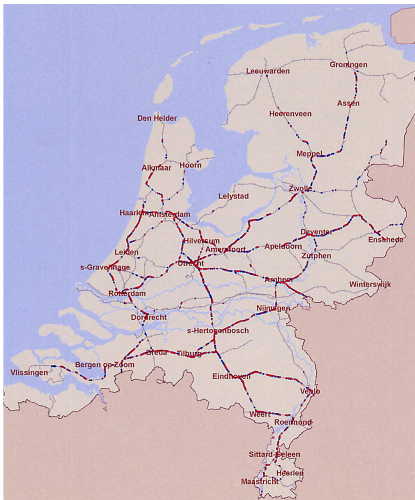
Figuur 1: knelpunten langs spoorwegen