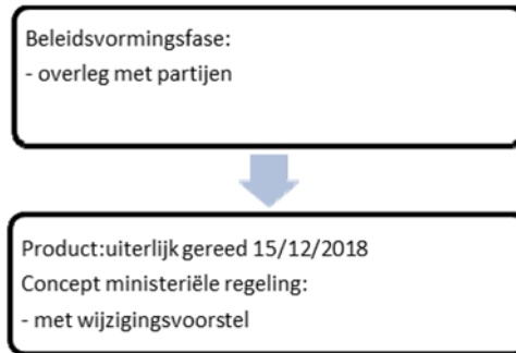
Figuur 3: Voorbereiding door VWS concept ministeriële regeling (inclusief afstemming met partijen)

Voor minder ingrijpende wijzigingen, zoals bijvoorbeeld een fictieve aanpassing van de voorwaarden voor de beschikbaarheidsbijdrage voor spoedeisende zorg in krimpregio's, kan de periode van voorbereiding korter. Zie het tijdspad hieronder.