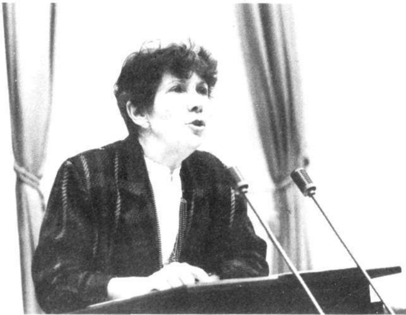
Staatssecretaris Korte-van Hemel van Justitie

De vijfde vraag, of uit het feit dat geen der asielzoekers is uitgezeten naar Pakistan moet worden afgeleid, dat Pakistan niet meer beschouwd kan worden als land van opvang is een onjuiste conclusie. Ik antwoord daar dus "neen" op. Pakistan kan worden aangemerkt als land van eerste opvang voor Afghaanse vluchtelingen. Dit oordeel baseer ik onder meer op het ambtsbericht dat ik van de minister van Buitenlandse Zaken ontving d.d. 13 oktober 1986.