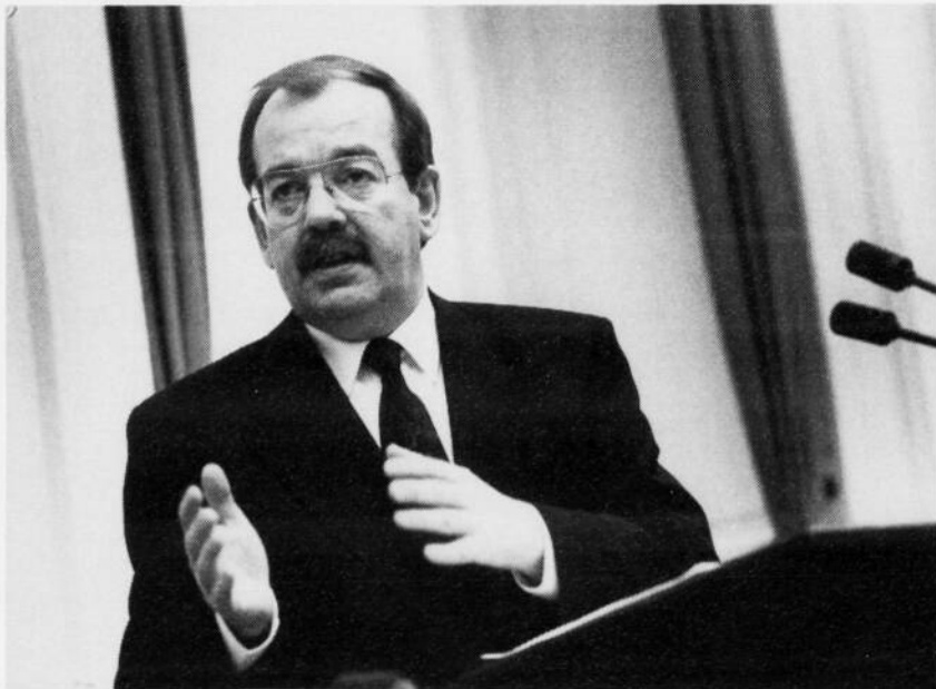
Minister Ter Beek van Defensie

Bij de wapenbeheersingsonderhandelingen in Wenen hebben de landen van het Warschaupact zich boven-